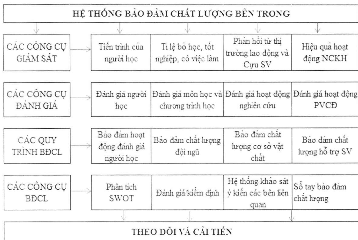
Hình 2.2. Mô hình đảm bảo chất lượng bên trong của Đại học Lạc Hồng

Mô hình đảm bảo chất lượng bên trong của Trường Đại học Lạc Hồng được xây dựng dựa trên hệ thống đảm bảo chất lượng của trường và mô hình đảm bảo chất lượng bên trong theo AUN-QA, đồng thời đối sánh với các trường đại học trong nước. Theo đó, mô hình BDCL bên trong bao gồm các công cụ giám sát, các công cụ đánh giá, các quy trình đảm bảo chất lượng và các công cụ đảm bảo chất lượng được trình bày chi tiết như hình 2.1: